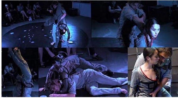
Le corps transfiguré par le numérique

Le spectacle «Echelles tactiles» de la compagnie K. Danse et du couple d'artistes du monde numérique Scenocosme joué en 2012 au festival des Bains numériques. Les mouvements et types de touches des deux danseurs, le corps muni de capteurs modulent la musique.